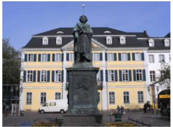
Beethoven-Denkmal in Bonn