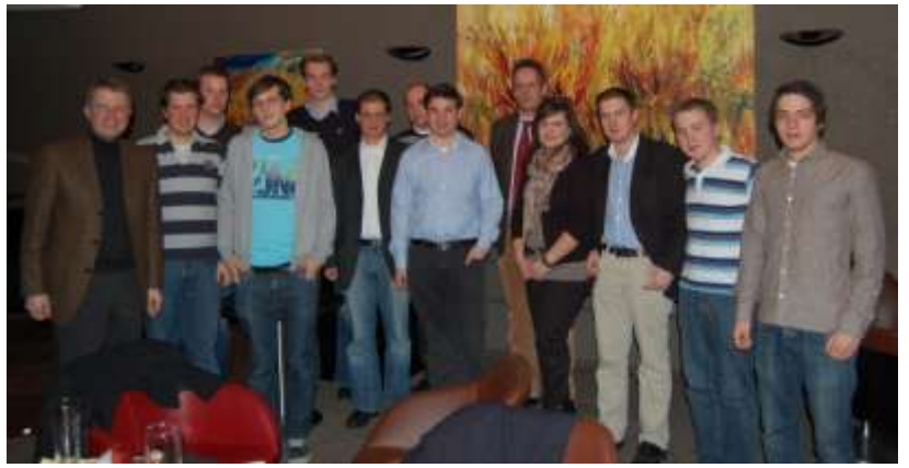
die JuLis mit Frank Schäffler (links)

Auf der, mit rund 50 Teilnehmern sehr gut besuchten, Veranstaltung in der Junkernschänke hielt Schäffler zunächst einen kurzen Vortrag über die Ursachen der Finanzkrise und das staatliche Geldmonopol bevor er in die Diskussion mit den Teilnehmern einstieg. In dieser kamen vor allem die horrende Staatsverschuldung Griechenlands und die Auswirkungen dieser auf die Stabilität des Euros zur Sprache.